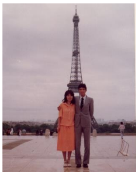
avec ma femme